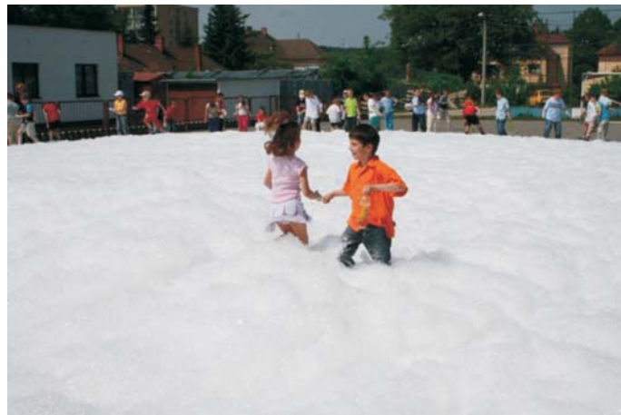
▲ Likvidácia požiaru ľahkou ekologickou penou.