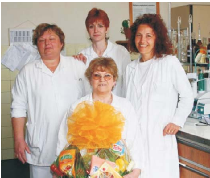
▲ Kolektív laborantiek ORK organickej a malotónážnej chémie, ktorý bol vylosovaný v ankete o "Miss Tvar NCHZ".

Výborná je teraz situácia na trhu s karbidom, z ktorého koncom roka odišli dve konkurenčné fabrique. Chcel by som aj touto cestou poďakovať všetkým ľuďom vo výrobe za to, že sme v posledných mesiacoch dokázali vyrobiť a predáť rekordné množstvo v celej histórii karbidky. Tu hráme európsku ligu a patríme k lídrom na trhu. Dobré ide aj organika a špeciality. Malotónážna chémia môže byť budúcnosť tejto fabrique. Bola dobre rozbehnutá a ideme ďalej investovať v rádoch stamilióny do jej modernizácie a ekologizácie. -SM-