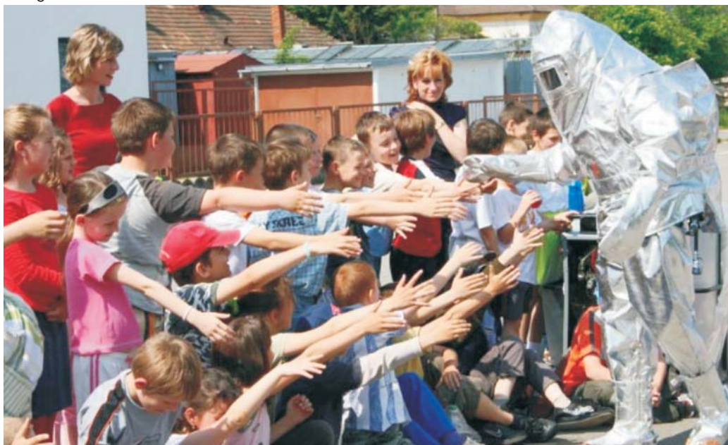
▲ Ukážka ochranného obleku proti sálavému teplu OL-2 používaného hasičmi pri zásahu. Viac sa dočítate na 4. strane.

V blízkosti Športcentra nie je možnosť parkovania. Parkovať je možné iba na zriadených parkoviskách v Bojniciach.