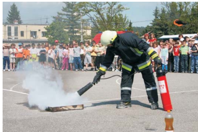
▲ Ukážka používania snehového prenosného hasiaceho prístroja pri likvidácii požiaru v horľavej kvapaline.