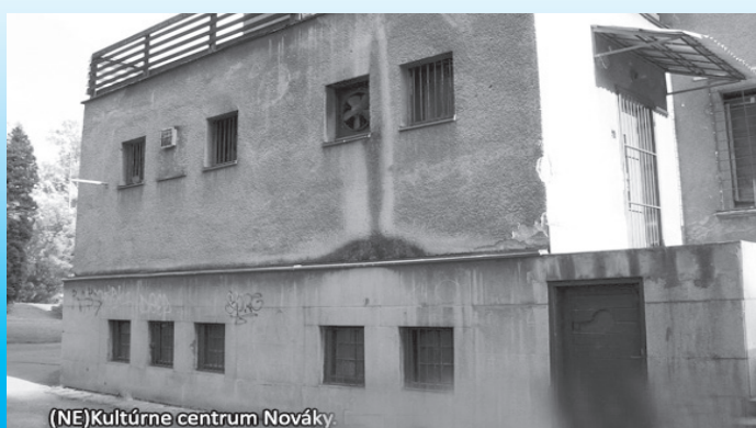
(NE)Kultúrne centrum Nováky