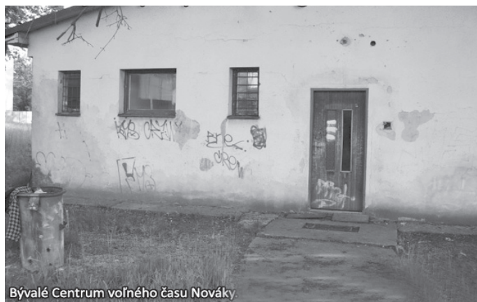
Bývalé Centrum voľného času Nováky