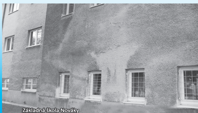
Základná škola Nováky