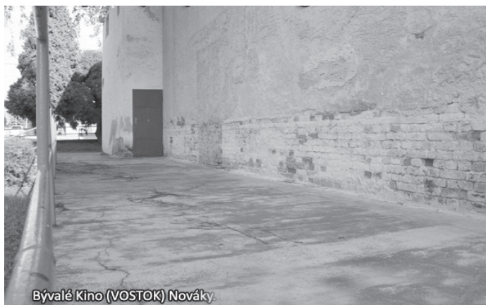
Bývalé Kino (VOSTOK) Nováky

ĎAKUJEME, PÁN PRIMÁTOR, ZA DVADSAŤTROJROČNÉ „ÚSPEŠNÉ“ PÔSOBENIE!