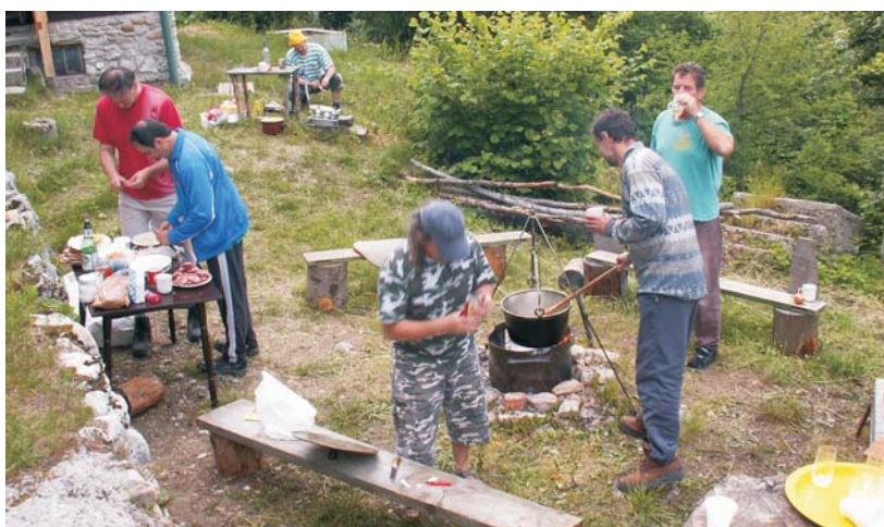
▲ Suroviny na guláš pripravovali všetci.