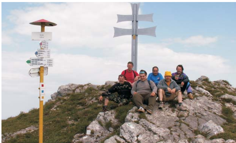
▲ ... a sme na brale Klák...

V dňoch 18. a 19. júna 2009 využili členovia odborového úseku pri ZP E PVC III-IV odstávku výroby a 15 členov kolektívu absolvovalo „relaxačno-oddychový“ pobyt v prekrásnom prostredí Fačkovského sedla.